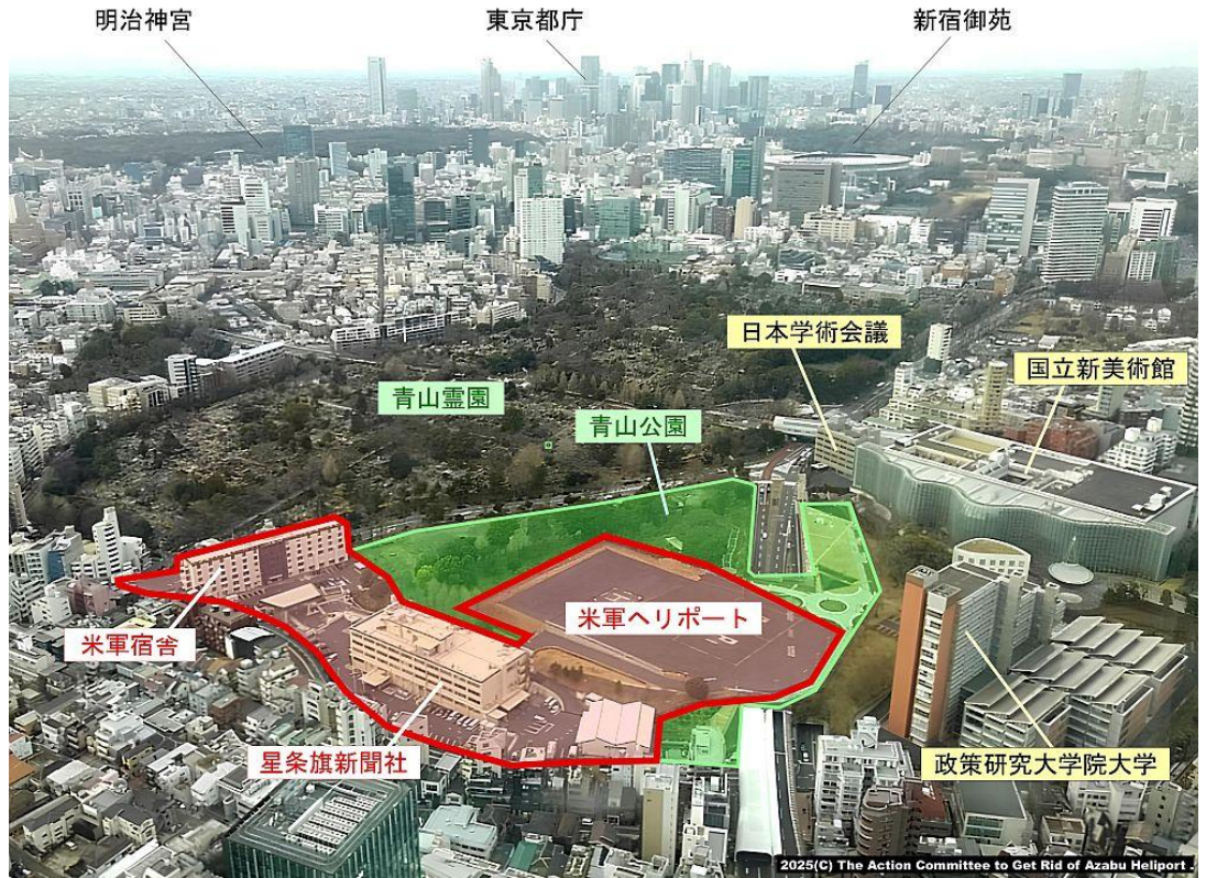
ご存じですか？都心の米軍基地(六本木ヒルズから撮影)

私たちは基地撤去を基本要件として、当面の課題として騒音や飛行の安全措置を米軍に徹底させるよう要請しています。